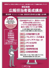
広報、地域関連講座（一部）